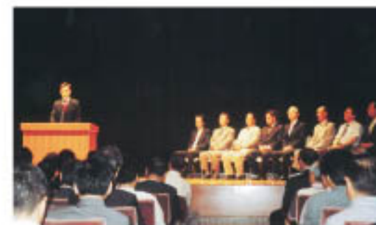
早坂氏のために各界より応援の声