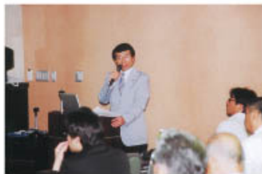
「大地震に備えた倒壊しない建物づくり」