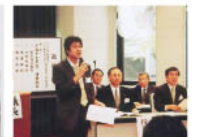
閉会の辞：長田相談部長