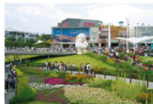
会議翌日は開催中の「愛知万博」を視察しました