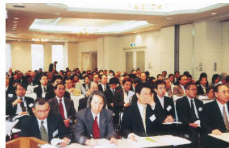
会場いっぱい勉強熱心な会員が集まりました