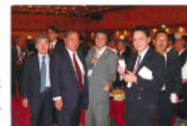
左から2人目、森広報部長