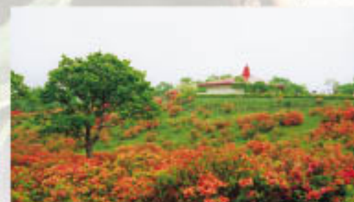
ツツジの美しい、赤城山公園