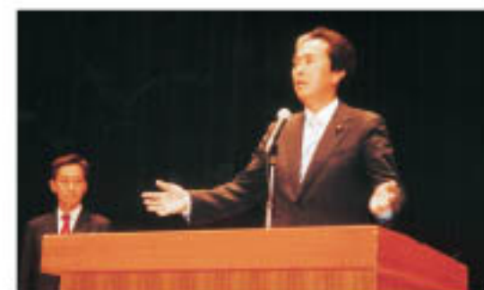
石原伸晃代議士 (左は早坂氏)