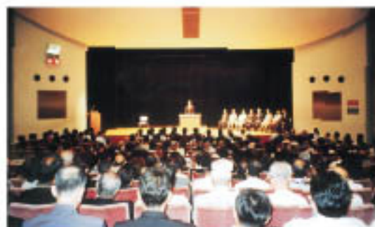
会場には400人以上、多くの方々が集まりました