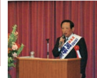
杉並区議会議員 河野庄次郎様