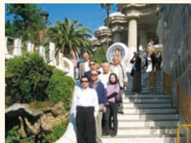
ガウディー設計のグエル公園

たガウディの作品を見学してまいりました。「グエル公園」はもともとアントニオ・ガウディの設計した分譲住宅で、1900年から1914年の間に同時に広場、道路などのインフラが作られ60軒が計画されていたが買い手が見つらず、結局売れたのは2軒で、買い手はガウディ本人と発注者のエウセビオ・グエル伯爵だけであったということです。グエル伯爵