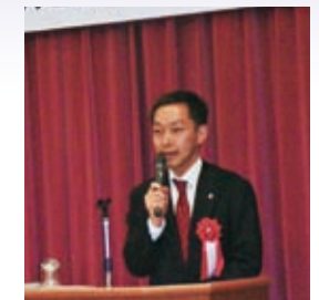
都議会議員 早坂よしひろ様