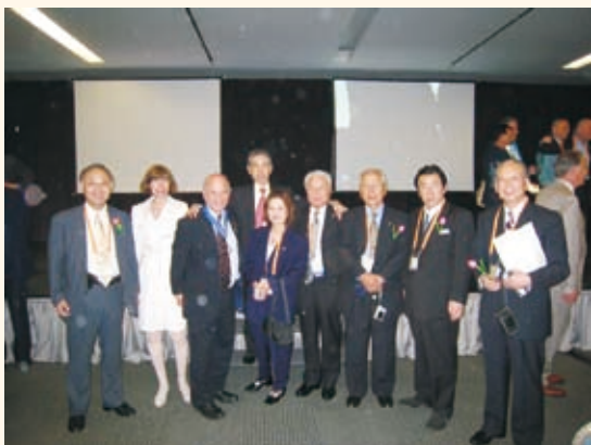
全日代表団と次期会長のジョセフ氏ご夫妻

このたびの世界不動産連盟の大会は、まさに世界中の不動産業者が一同に顔を合わせる大規模な大会となりました。今年度のメインテーマは『世界の不動産における金融と情報技術 (IT)』であり、全日代表団一同、連日多くの講演を聴講して