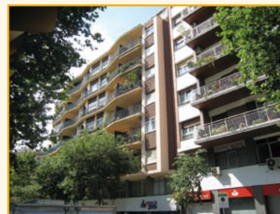
バルセロナ市内の高級マンション