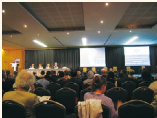
総会シンポジウム