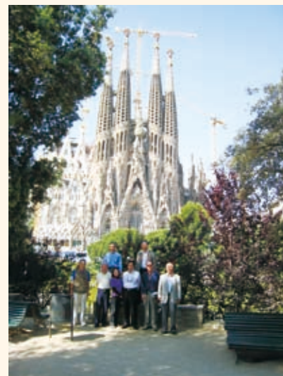
サグラダファミリアの前で