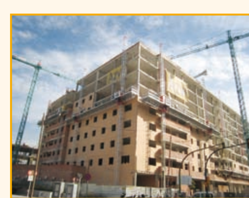
建築中の分譲マンション