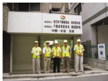
◀中野区 都市整備部から担当者も来所