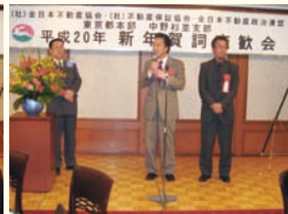
多摩南、町田支部役員