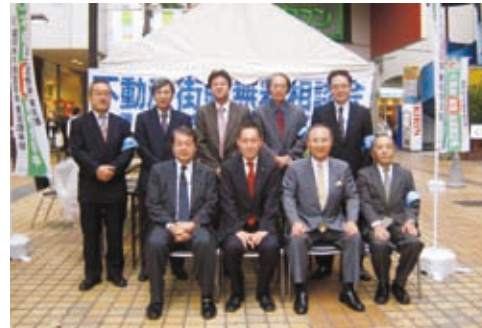
前列左より二人目が早坂都議