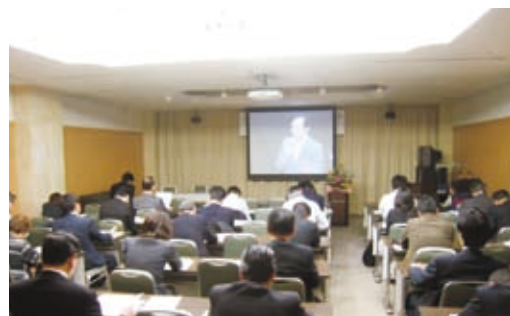
林支部長より ご挨拶