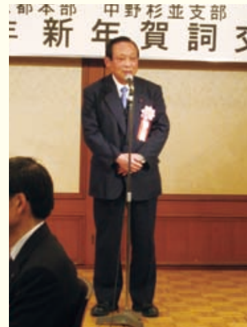
杉並区議会議員 河野庄次郎先生