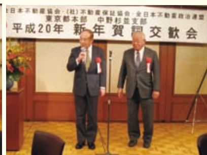
豊島文京支部役員