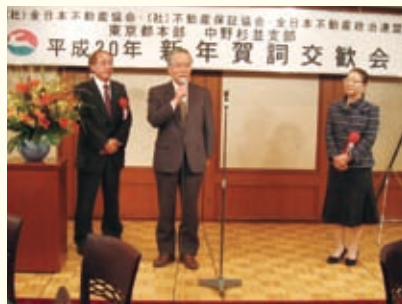
練馬、多摩北、多摩西支部役員