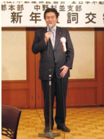
参議院議員 秋元 司先生